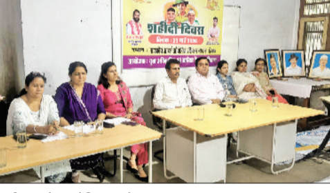
रोहतक। कार्यक्रम को सम्बोधित करते मुख्य वक्ता।

शहीदी दिवस के अवसर पर राजकीय आईटीआई में अमर क्रांतिकारी भगत सिंह, सुखदेव और राजगुरु को भावपूर्ण श्रद्धांजलि अर्पित की गई। युवा अधिकारिता एवं उद्यमिता विभाग के दिशा-निर्देशानुसार आयोजित कार्यक्रम में छात्रों और स्टाफ ने शहीदों के अद्वितीय बलिदान को याद करते हुए राष्ट्र निर्माण और सामाजिक एकता का संकल्प लिया। इस मौके पर संस्थान में श्रद्धांजलि सभा और भाषण प्रतियोगिता का आयोजन किया गया। छात्रों ने शहीदों के चित्रों पर माल्यार्पण कर उन्हें नमन किया