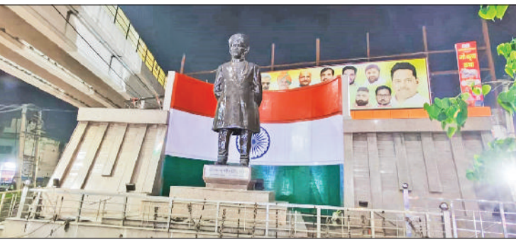
रोहतक। छोटूराम चौक पर नहीं जलती लाइट।